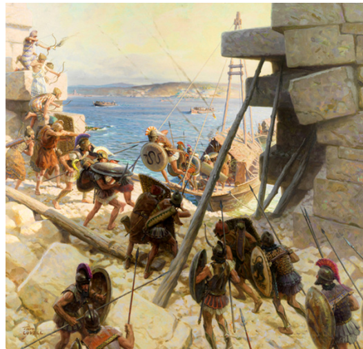
Soldados macedônios atacando Tiro

https://www.infoescola.com/wp-content/uploads/2010/04/cerco-de-tiro2.gif